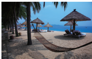
ビーチでお昼寝タイム。