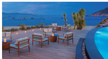
ビーチとインフィニティプール沿いで大人のひとときを。