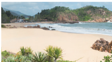
手つかずの自然が豊富。